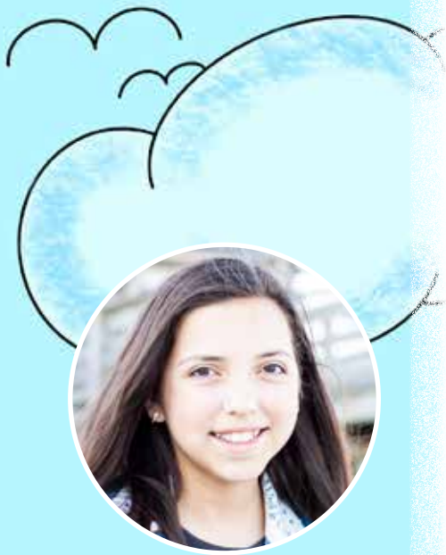
Ilustración por Kelsey Pinedo (12 años)

Dios. Pero nosotros no debemos dejarle hacer eso. Al orar cada día para encontrar fortaleza, conservar a Dios en nuestra mente y leer la Palabra de Dios, llegaremos a acercarnos más a Dios y será más difícil que Satanás nos aleje. Dios nos dice en la Biblia que al final el diablo tendrá su castigo.