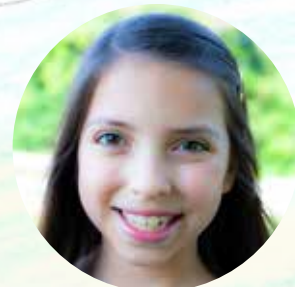
Todas las ilustraciones en esta sección por Kelsey Pinedo (10 años)